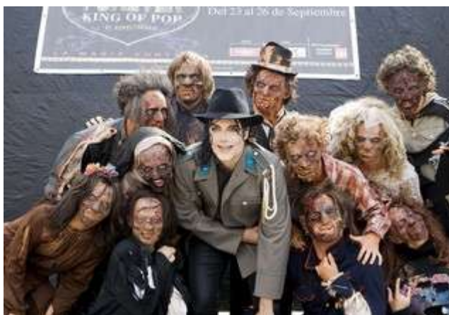
Presentación en Zaragoza del musical "Forever King of Pop".

ZARAGOZA.- El espectáculo "Forever king of Pop", un musical sobre Michael