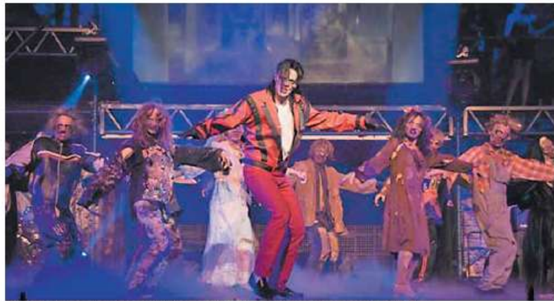
Más de 40 artistas entre músicos y bailarines se subirán al escenario para conmemorar a Michael Jackson.

Teatro Alameda Hasta el domingo, seis pases Entradas: 45 euros