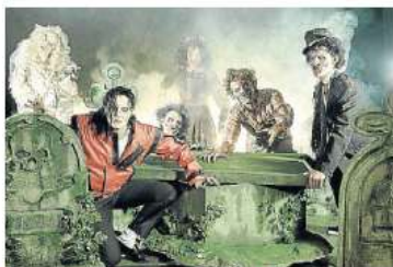
Recreación del videoclip de Thriller durante el espectáculo.